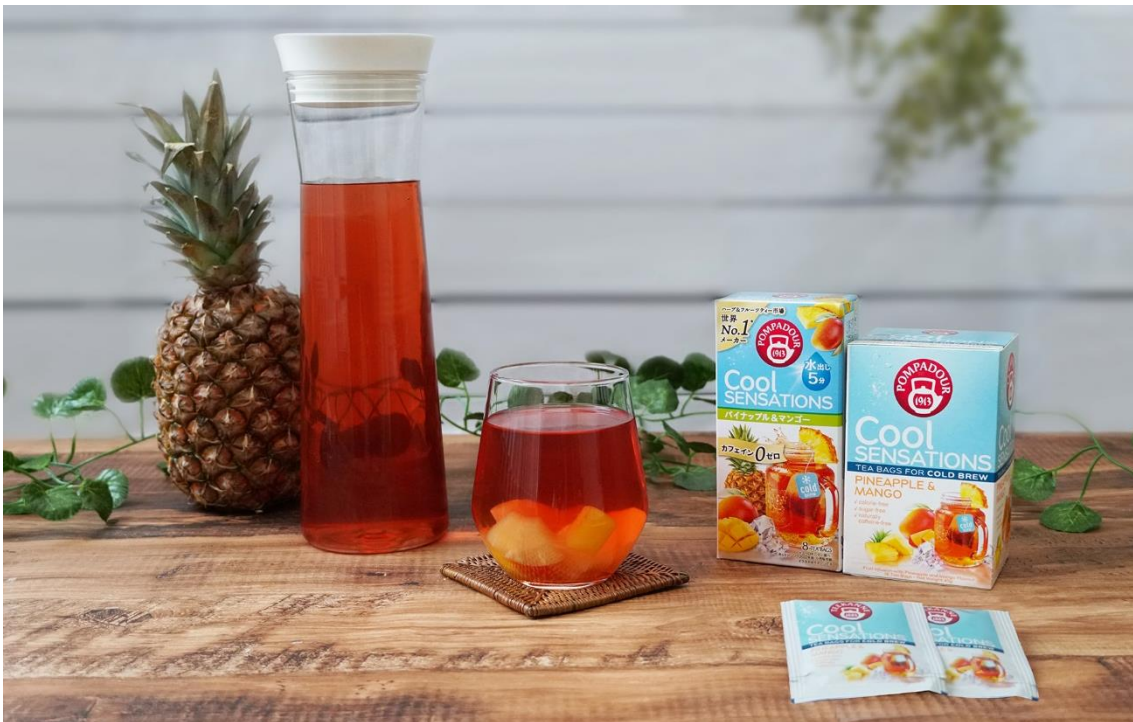
左:8ティーバッグ入り/右:18ティーバッグ入り

ポンパドール・ハーブティー、クレイジーソルト、茶語(Cha Yū)、ティーブティックを手がける日本緑茶センター株式会社は、ドイツの老舗ハーブティーブランド・ポンパドールの水出しシリーズ・クールセンセーション新商品、パイナップルのフレッシュな香りとマンゴーのジューシーな甘さが楽しめる「パイナップル&マンゴー」を、2023年2月17日(金)に発売いたします。