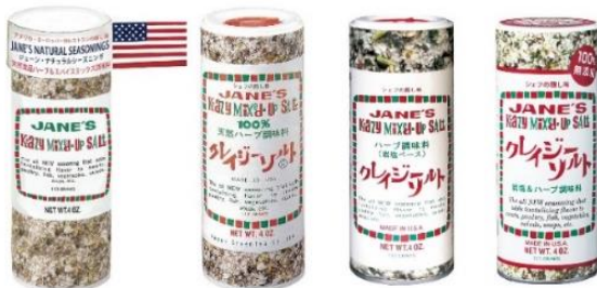
左上：ジェーンおばさん 右上：現在のクレイジーソルト 左：クレイジーソルト・パッケージデザインの変遷