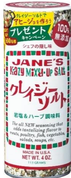
キャンペーン告知付き商品パッケージ

キャンペーンサイト : https://krazysalt-ajillo.jp (2022年10月1日サイトオープン)